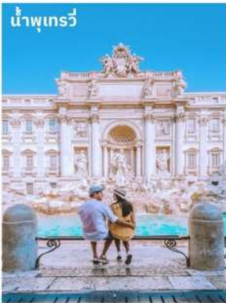
น้ำพุเทรวี

จากนั้นอิสระตามอัธยาศัยกับการเลือกซื้อสินค้าแฟชั่นและของที่ระลึกในบริเวณย่าน บันไดสเปน (The Spanish Step) ซึ่งเป็นแหล่งแฟชั่นชั้นนำสุดหรูและยังเป็นแหล่งนัดพบของชาวอิตาเลียน