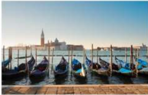
เรือกอนโดลา

นำท่านออกเดินทางสู่ ท่าเรือตรอนเคโต เพื่อเตรียมตัวนั่งเรือข้ามสู่เกาะเวนิส เกาะเวนิสเป็นดินแดนแสนโรแมนติก เป็นเมืองที่ไม่เหมือนใคร โดยใช้เรือแทนรถ ใช้คลองแทนถนน มีสมญานามว่าเป็น “ราชินีแห่งทะเลเอเดรียติก” มีเกาะน้อยใหญ่กว่า 118 เกาะและมีสะพานเชื่อมถึงกัน กว่า 400 แห่ง