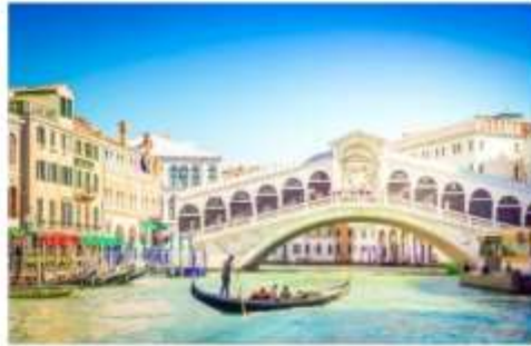
สะพานริอัลโต