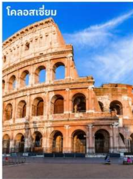
โคลอสเซียม