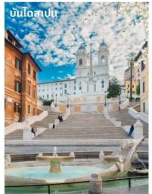
บันไดสเปน