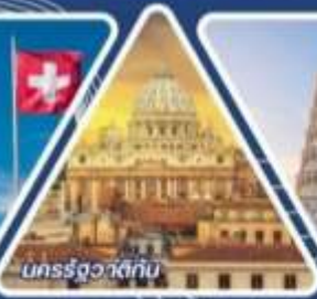
นครรัฐวาติกัน