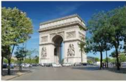
ประตูชัย

นำท่านเดินทางเข้าสู่ หอไอเฟล ถ่ายรูปเป็นที่ระลึกกับสัญลักษณ์ที่โดดเด่นสูงตระหง่านคู่นครปารีส จากนั้นนำท่านเดินทางเข้าสู่ย่านใจกลางเมืองปารีสเพื่อ ถ่ายรูปกับประตูชัย อีกหนึ่งสัญลักษณ์ของมหานครแห่งนี้ และเดินทางสู่ พิพิธภัณฑ์ลูฟร์ ให้ท่านได้ถ่ายรูปด้านหน้าพีระมิดแก้วของพิพิธภัณฑ์ลูฟร์ เป็นพิพิธภัณฑ์ทางศิลปะที่มีชื่อเสียงที่สุด เก่าแก่ที่สุดและใหญ่ที่สุดแห่งหนึ่งของโลก