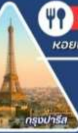
กรุงปารีส