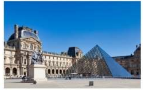
พิพิธภัณฑ์ลูฟร์

หลังจากนั้นนำท่านเดินทางสู่ La Vallee Village Outlet