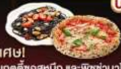
พิเศษ! สปาเกตตี้ซอสหมัก และพิซซ่านาโปลี