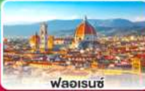
ฟลอเรนซ์