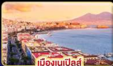
เมืองเนเปิลส์