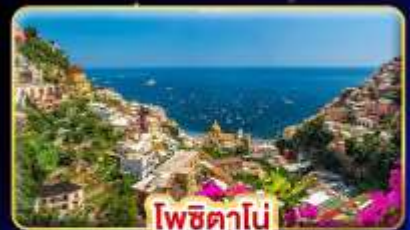
โพซิทานิ