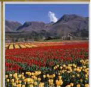
"KUJU HANA PARK"