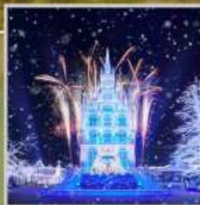
"HUIS TEN BOSCH"