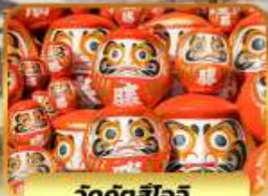
วัดคังสึโอจิ