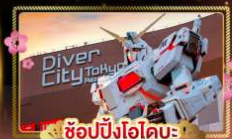
ช้อปปิ้งไอโดบะ