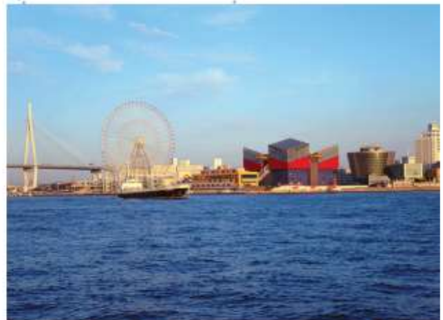
VISIT TEMPOZAN MARKET PLACE