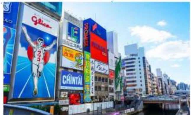
SHOPPING AT SHINSAIBASHI

"โรงงานชิกิกะโช" ชมมินิรูสมน ของฝากสุดคลาสสิกจากโอซาก้า มีขนมหวานมากกว่า 100 ชนิด รวมถึงขนมและเค้กญี่ปุ่น ท่านสามารถเพลิดเพลินกับการช้อปบั้งขนมหวานได้ตามใจชอบ