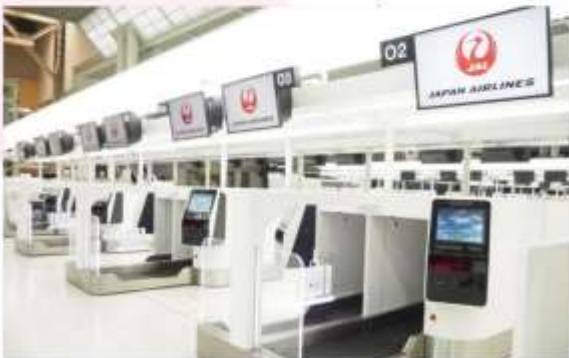
NARITA INTERNATIONAL AIRPORT

“สนามบินนานาชาตินาริตะ” เป็นสถานที่ที่นักท่องเที่ยวส่วนใหญ่จะได้สัมผัสเป็นที่แรกหลังจากมาถึงญี่ปุ่น ที่มีเป็นสนามบินที่ทันสมัย สะดวกสบาย และได้บริการออกแบมาเป็นอย่างดี อาคารผู้โดยสารหลักสองแห่งมีทั้งร้านค้า ร้านอาหาร พื้นที่นั่งรอสุดผ่อนคลาย หอชมทิวทัศน์ และกิจกรรมต่างๆ ที่จะทำให้คุณเพลิดเพลินอยู่ตลอด