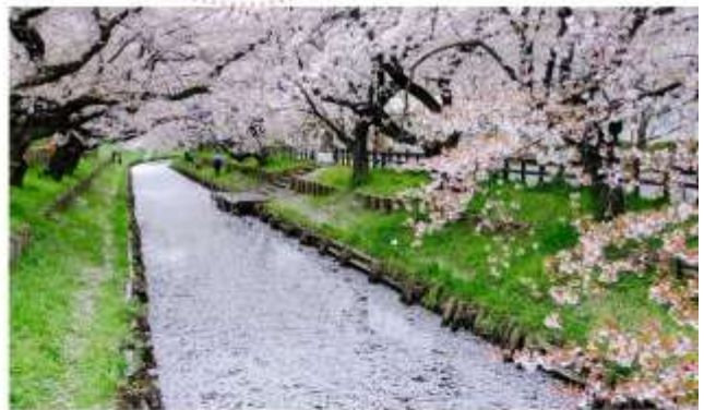
SHINGASHI RIVERBANK CHERRY BLOSSOMS

“ชมความงดงามของซากุระ-ริมแม่น้ำชินกาชิ” ในเมืองคาวาโกเอะ จังหวัดไซตามะ: เป็นอีกหนึ่งสถานที่ที่ได้รับความนิยมอย่างมากในช่วงฤดูใบไม้ผลิ ด้วยความงดงามของดอกซากุระที่เบ่งบานสะพรั่งสองข้างทางริมแม่น้ำยาวกว่า 500 เมตร ภาพของดอกซากุระ-สีชมพูอ่อนโยนที่สะท้อนลงบนผิวน้ำ สร้างบรรยากาศที่โรแมนติกและงดงามราวกับภาพวาด