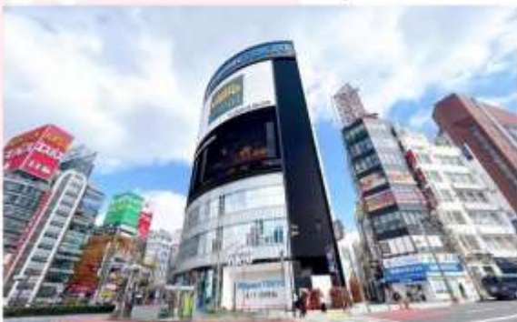
SHOPPING AT SHINJUKU

เพลิดเพลินกับการช้อปปิ้ง และสัมผัสบรรยากาศอันคึกคัก กันสมัยของ “ย่านชินจูกุ” แหล่งช้อปปิ้งสุดคูลิ่งการ ที่รอให้เหล่านักช้อปปิ้งทั้งหลาย มาตะลุย! ไม่ว่าคุณจะมาหาแฟชั่นล่าสุด เครื่องใช้ไฟฟ้าสุดไฮเทค หรือของฝากสุดพิเศษ ชินจูกุมิครบทุกอย่างให้คุณได้ช้อปปิ้งเพลิน