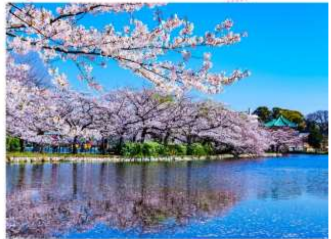
รับประทานอาหารกลางวัน ณ กิตตาคาร