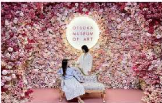
OTSUKA MUSEUM OF ART