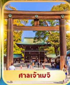
ศาลเจ้าเมจิ