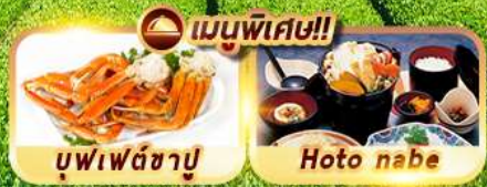
บุฟเฟ่ต์ซาปู