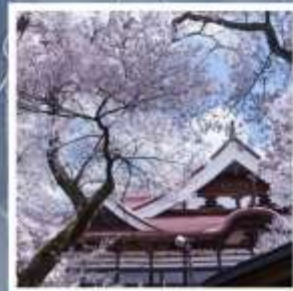
สวนสาธารณะซากุระปราสาทคาเคียว