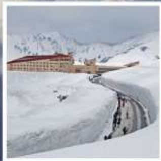
กำแพงหิมะ เจแปนแอลป์