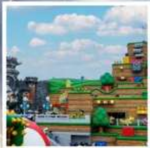
ยูนิเวอร์ซัล สตูดิโอส์ เจแปน