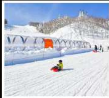
ลานสกี กาล่า ยูซาวะ