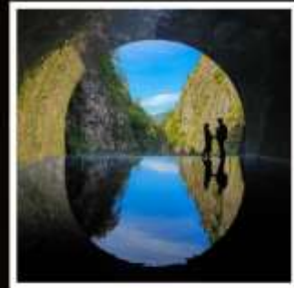
หุบเขาคิโยสึ

เปิดประสบการณ์ใหม่กับฮิปโปบัส ล่องเรือสะเก็นน้ำสะเก็นบกกกลางกรุงโตเกียว!!