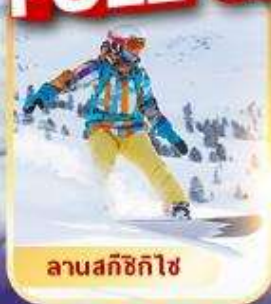
ลานสกีซิกิไซ