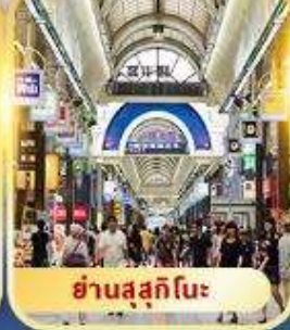
ย่านสุซุกิโนะ