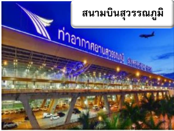
สนามบินสุวรรณภูมิ

สนามบินสุวรรณภูมิ – สนามบินคันไซ – ซัปโปโปะชิโนไซบาชิ