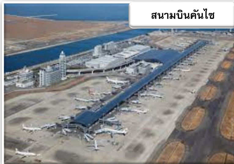
สนามบินคันไซ

เวลา 15.55 น. เดินทางถึง สนามบินคันไซ ประเทศญี่ปุ่น นำท่านผ่านขั้นตอนการตรวจคนเข้าเมืองและศุลกากร