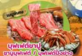
บุฟเฟ่ต์ชาปู ชาบูบุฟเฟ่ต์ / บุฟเฟ่ต์บิงชัง