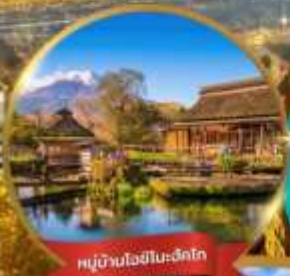
หมู่บ้านโอชิโนะฮักโก