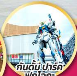
กัณฑ์ม.ปาร์ค ฟุกุโอกะ