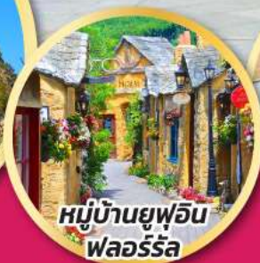
หมู่บ้านยูฟูอิน พลอร์ริล