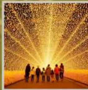
"NABANA NO SATO"