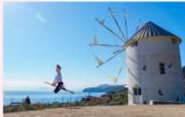
SHIDOSHIMA OLIVE PARK