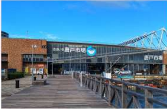
KARATO FISH MARKET

“ตลาดปลาคาราโตะ” เป็นตลาดปลานขนาดใหญ่ มีชื่อเสียงเรื่องความสดใหม่ของอาหารทะเล โดยเฉพาะปลาปักเป้า ปลาโท และปลาฮามาจิ ที่เป็นของดีประจำถิ่น สืบลองซูชิที่ทำจากวัตถุดิบสดๆ ส่งตรงจากทะเล พร้อมชนบรยากาศตลาดปลานญี่ปุ่นที่คึกคักและมีชีวิตชีวา