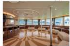
รับประทานอาหารกลางวัน ณ กิคุคาคุวาระ