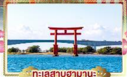
ทะเลสาบฮามานะ