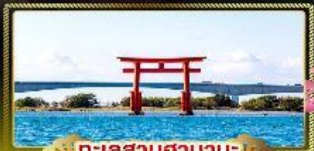
ทะเลสาบฮามานะ