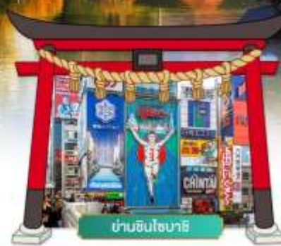
ย่านชินโซบะชิ