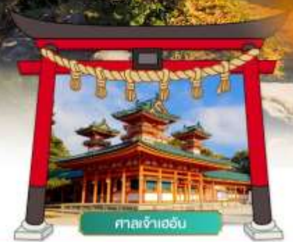
ศาลเจ้าเฮอัน

เดินทางโดยสายการบิน : ไทยแอร์เอเชียเอ็กซ์