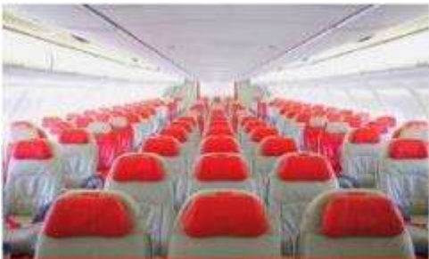
เครื่องบินลำใหญ่ 377 ที่นั่ง

ตัวเครื่องบินเป็นตัวกรู๊ปสำหรับคณะทัวร์ ระบบของสายการบินจะทำการแรนดอมที่นั่ง ซึ่งไม่สามารถล็อกหรือเลือกกระบุนั่งได้ หากลูกค้าต้องการเลือกกระบุนั่ง ทางสายการบินมีบริการอัพเกรดที่นั่ง (ค่าบริการเป็นไปตามที่สายการบินกำหนด)