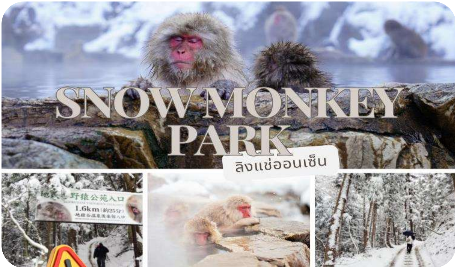
ลิงแช่ออนเซน

นำท่านเดินทางสู่ สวนลิงจิโกคุดาบิ (Jigokudani Monkey Park) หรือสวนลิงออนเซน (Snow Monkey Park) เป็นส่วนหนึ่งของอุทยานแห่งชาติโจชินเอ็ตสึ โคเจ็น (Joshinetsu Kogen) ตั้งอยู่ในหุบเขาจิโกคุดาบิ (Jigokudani) ที่มีความหมายว่า “หุบเขานรก” เนื่องจากบริเวณของหุบเขายังคงมีไอน้ำและน้ำพุร้อนที่ออกมาจากรอยแยกเล็กของพื้นดิน เป็นแหล่งท่องเที่ยวอีกแห่งหนึ่งที่ได้รับความนิยมจากนักท่องเที่ยวที่มาเยือนเมืองนาగాโนะ (Nagano) นำท่านเดินเท้าเข้าไปยังบ่อออนเซนที่มีฝูงลิงญี่ปุ่นแก้มแดงกำลังแช่ออนเซนคลายหนาวกันอย่างสบายใจ อิสระให้ท่านเก็บภาพความน่ารักของฝูงลิงแก้มแดง และบรรยากาศความสวยงามรอบๆ บ่อออนเซนแห่งนี้