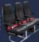
ราคา 2,700 /เที่ยว

ที่นั่งพิเศษกว้างเกือบถึง 17.5 นิ้ว กระจกบังแดดในตัวสำหรับทางลัดทางอากาศ พร้อมที่นอนที่ถอดออกได้