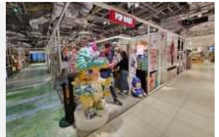
POP MART สายจุ่มถูกใจสิ่งนี้ !