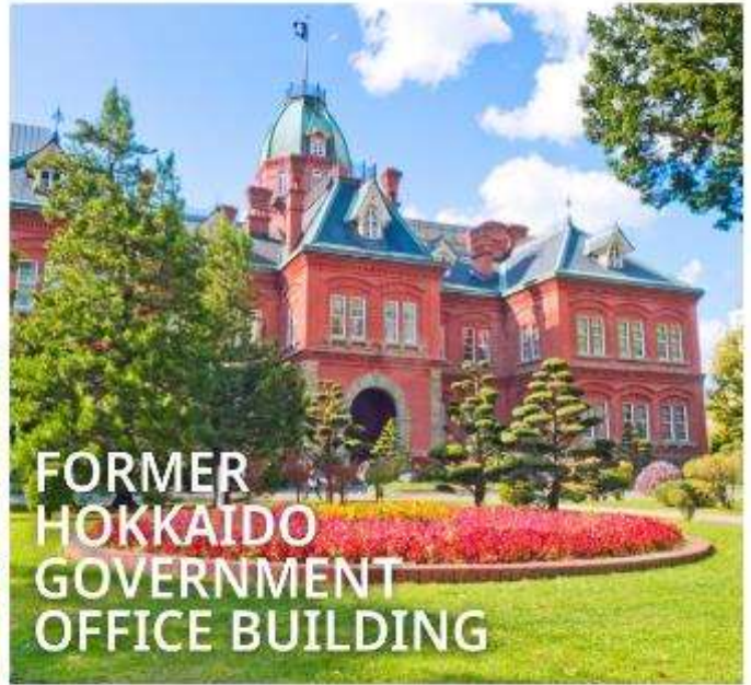
FORMER HOKKAIDO GOVERNMENT OFFICE BUILDING

เป็นตึกสไตล์นีโอบารอก มีลักษณะพิเศษที่มีหลังคายอดแหลมและกรอบหน้าต่างเป็นเอกลักษณ์ เปรียบเสมือนอนุสาวรีย์การบุกเบิกของฮอกไกโด ปัจจุบันได้รับการขึ้นทะเบียนเป็นมรดกทางวัฒนธรรมของชาติ