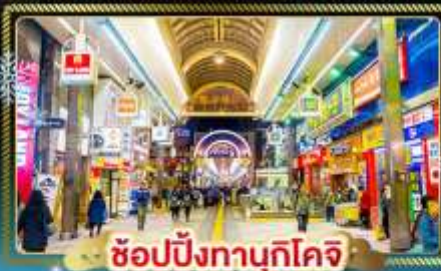
ช้อปปิ้งทานุกิโคจิ