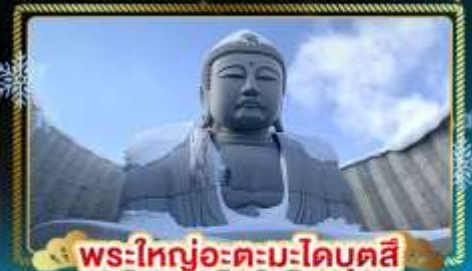
พระใหญ่อะตะมะโดบุตสึ