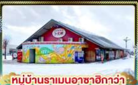
หมู่บ้านราเมนอาซาฮิกาว่า