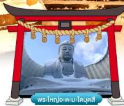
พระใหญ่อะตะมะโคบุตสึ