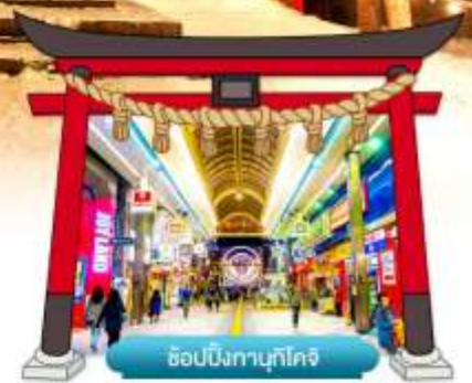
ช้อปปิ้งทานุกิโคจิ