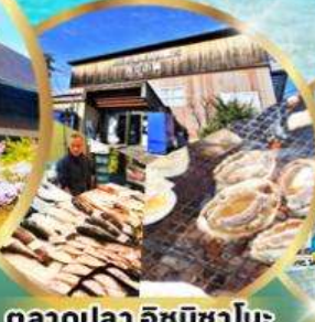
ตลาดปลา อิซุมิซาโนะ