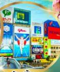
ช้อปปิ้ง ย่านชินโซบาชิ