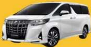
Alphard (2-4 ท่าน)