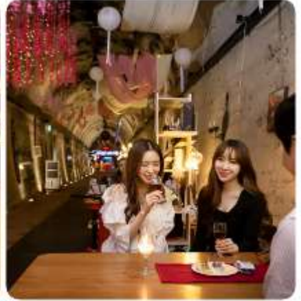
ตามใจชอบ

ถ้าไวน์แห่งกิมแฮ ไร่เบอรี่พันธุ์ที่ถูกคัดสรรมาอย่างดี ผลิตผลทางการเกษตรที่ออกงามอย่างสมบูรณ์ในภูมิภาค และภูมิอากาศของกิมแฮ วัตถุประสงค์ตั้งต้นสุดพิเศษ เพื่อนำมาผลิตเป็นไวน์ชั้นเลิศ... กับสถานที่หมักไวน์ที่ไม่เหมือนที่ใดในโลก นั่นคืออุโมงค์แซงนิม อุโมงค์รถไฟที่ถูกทิ้งร้าง ถูกบูรณะและสร้างเป็นที่บ่มและเก็บไวน์ตลอดความยาว 215 เมตรของอุโมงค์แห่งนี้ ถูกตกแต่งและจัดสรรเป็นพื้นที่แห่งความสุข โดยมีทั้งหมู่บ้านสตอรี่ของเบอรี่ มาสคอตของอุโมงค์แห่งนี้ ที่เป็นเหมือนสวนสนุกเล็ก ๆ และพร้อมด้วยร้านจำหน่ายไวน์ไร่เบอรี่ และไวน์อีกหลากหลายชนิดมีไว้ให้ชิม และเลือกสรร