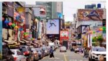
nampodong shopping street

*ทางบริษัทฯ ขอสงวนสิทธิ์ในการสลับโปรแกรมทัวร์ตามความเหมาะสมขึ้นอยู่กับสถานการณ์หน้างาน โดยคำนึงถึงผลประโยชน์ของลูกค้าเป็นสำคัญ