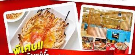
พิเศษ!! ก๊วยแม่ย่า + HOTPOT SEAFOOD