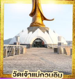
วัดเจ้าแม่กวนอิม