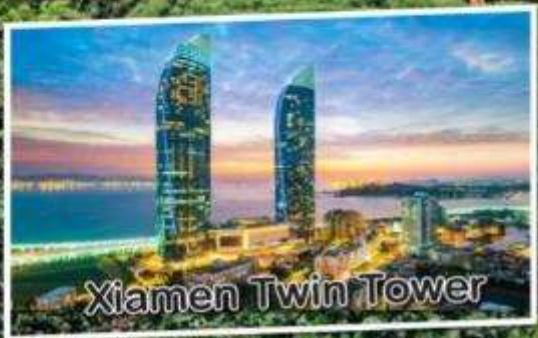
Xiamen Twin Tower