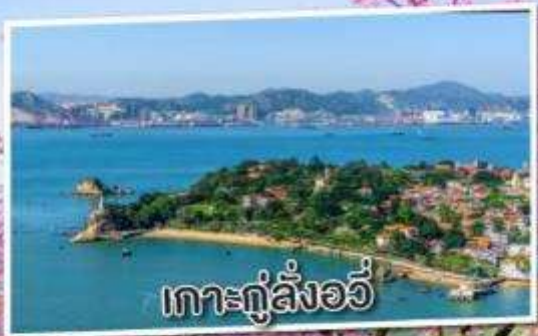
เกาะกู่ลิ่งอวี่