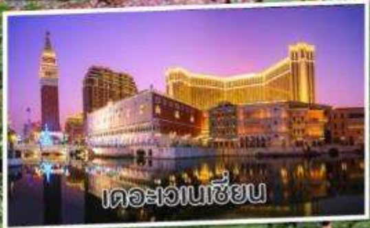
เดอะเวเนเซียน