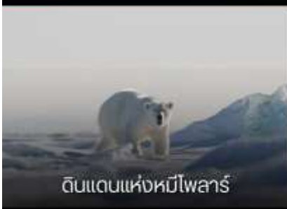
ดินแดนแห่งหมีโพลาร์