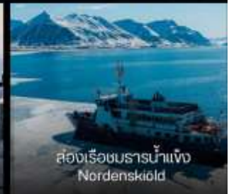
สองเรือชมธารน้ำแข็ง Nordenskiöld