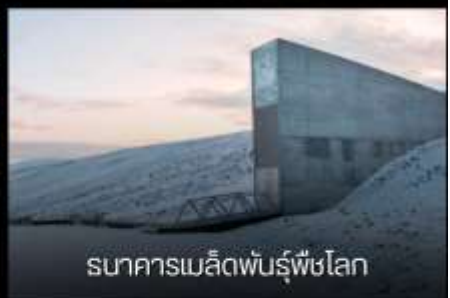
ธนาคารเมล็ดพันธุ์พืชโลก