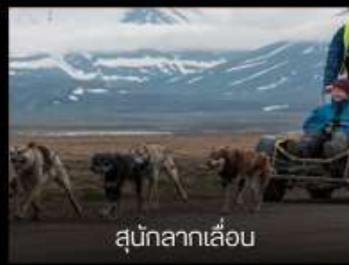
สุนัขลากเลื่อน