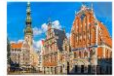
เมืองริกา

** พักที่ Bellevue Park Hotel Riga 4* หรือเทียบเท่า **