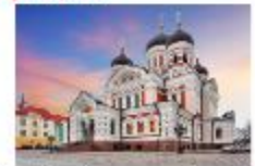
โบสถ์อเล็กซานเดอร์ เนฟสกี

19.35 น. ออกเดินทางสู่อิสตันบูล เที่ยวบิน TK1424