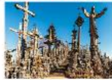
Hill of Crosses