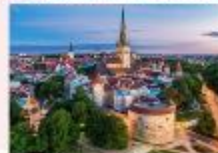
Tallinn Old Town