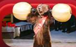
ชมละครสัตว์