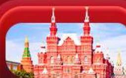
จัตุรัสแดง