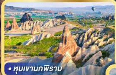
• หุบเขานกพรา