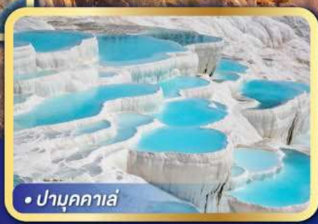
• ปามุกคาเล่