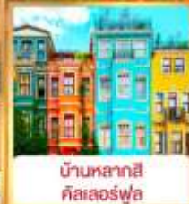
บ้านหลากสี คิสเลอร์ฟู