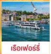
เรือเฟอร์รี่