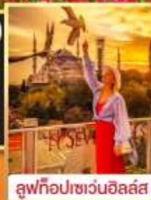
ลู่ฟือปเซเวนฮิลล์ส