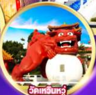
วัดเหวินหู่