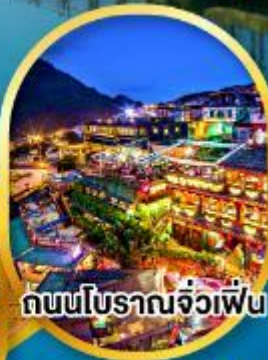
ถนนโบราณจิวเฟิ่น