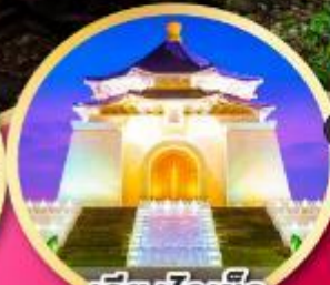
เจียงไคเช็ค