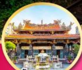
วัดหลงชาม