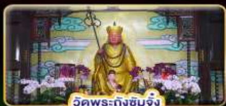
วัดพระถังซำจั๋ง