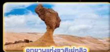
อุทยานแห่งชาติเย่หลิว