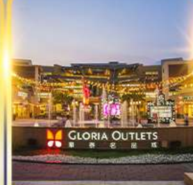
กลอเรีย เอาท์เล็ต