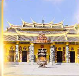
วัดซอพรเทพเจ้า