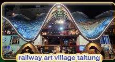
railway art village taitung