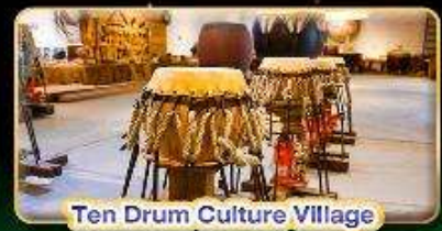
Ten Drum Culture Village