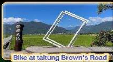
Bike at taitung Brown's Road