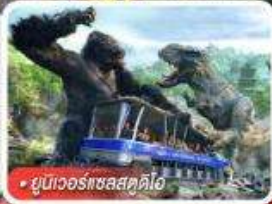
ยูนิเวอร์แซลสตูดิโอ