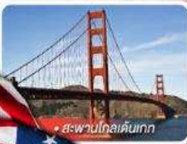
สะพานโกลเด้นเกต