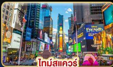
ไทม์สแควร์