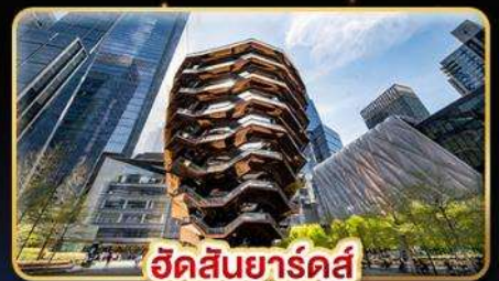
อ็อคูลัส