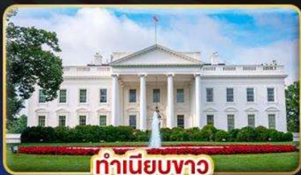
ทำเนียบขาว

ที่สุด "อเมริกาตะวันออก" ชมมหานครนิวยอร์ก ล่องเรื่อน้ำตกไนเอองการ่า