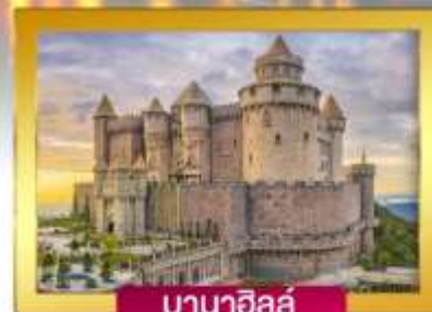
บานาฮิลล์