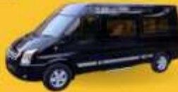
VAN (7-8 ท่าน)

สำหรับท่านที่ต้องการความเป็นส่วนตัวมากขึ้น ท่านสามารถเลือกใช้บริการ รถส่วนตัวได้ โดยมีรูปแบบรถให้เลือกถึง 2 ประเภท โดยรถ แต่ละประเภท สามารถนั่งได้ตั้งแต่ 2 ท่านขึ้นไป