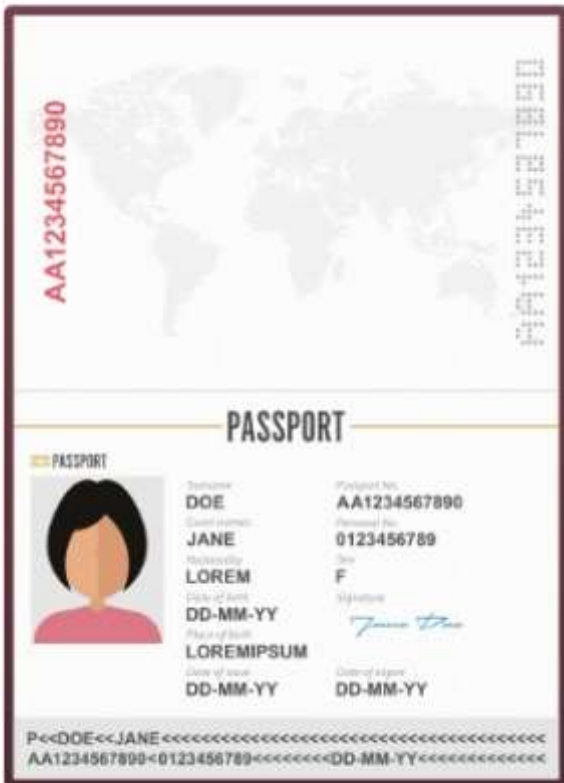
รูปถ่ายหน้าพาสปอร์ต