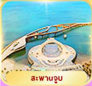
สะพานจูบ

ส่วนสนุก Vin Wonder + ส่วนน้ำ Aquatopia, Sun World Hon Thom