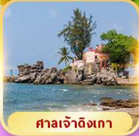
ศาลเจ้าดิ้งเกา