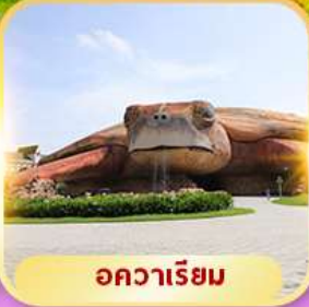
อควาเรียม